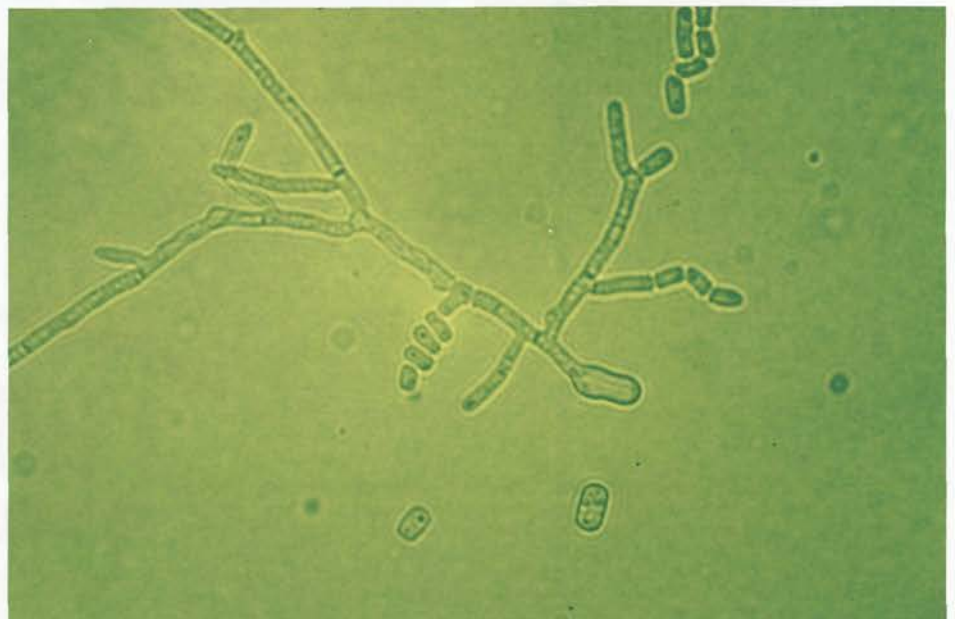
Abb. 8: Mikrokultur einer Geotrichum -Art auf Reisagar mit rechteckig-ovalen Gliederstücken (Arthrosporen), die sich vom echten Myzel abgespalten haben