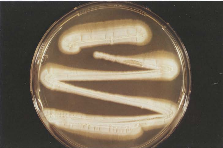
Abb. 6: Bis auf eine gering ausgeprägte Luftmyzelbildung sieht diese bei Zimmertemperatur auf Kimmig-Agar gewachsene Geotrichum -Art Trichosporon -Stämmen (Abb. 5) sehr ähnlich. Gerade in jungen Wachstumsstadien, bei noch fehlendem Geotrichum -Luftmyzel, kann es Verwechslungen geben. Bei älteren Kulturen ist eine fehlende Luftmyzelbildung jedoch diagnostisch richtungsweisend: Trichosporon -Arten bilden niemals Luftmyzel