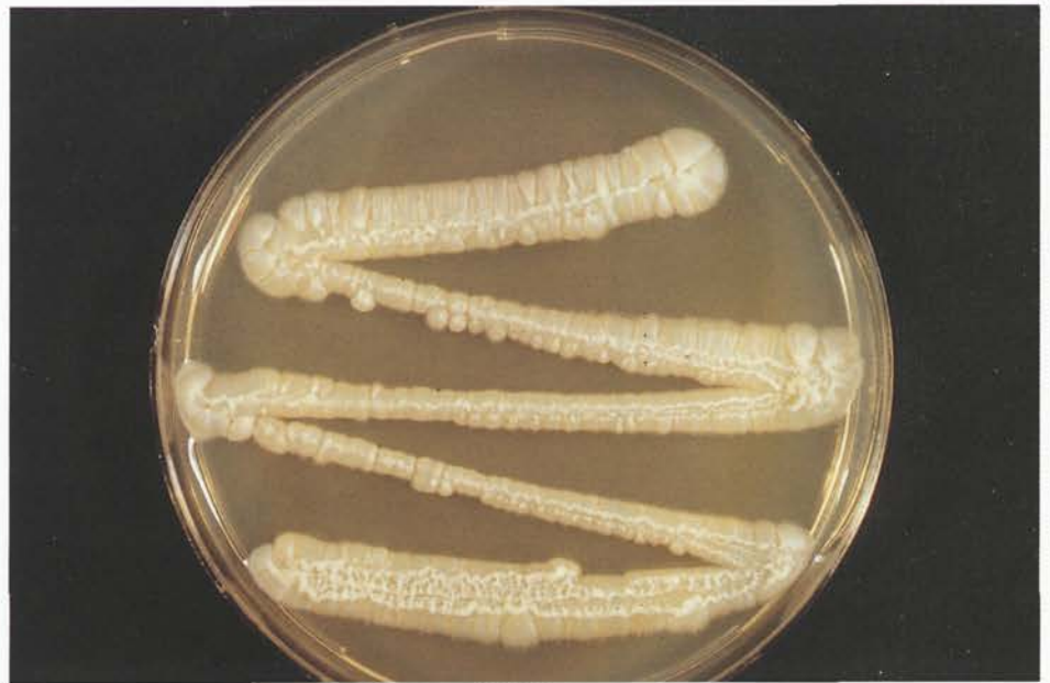
Abb. 5: Kultur von Trichosporon cutaneum bei Zimmertemperatur auf Kimmig-Agar. Diese Hefeart ist als Krankheitserreger bekannt und kann makroskopisch und mikroskopisch mit harmlosen Schimmelpilzen der Gattung Geotrichum verwechselt werden

Geotrichum-Arten sind filamentöse Pilze, die in der Natur häufig vorkommen und in der Klinik als Krankheitserreger bei immunsupprimierten Patienten beobachtet werden können. Sie sind morphologisch sehr variabel und können in Form von Rhizoideen, Spindeln oder Chlamydosporen auftreten.