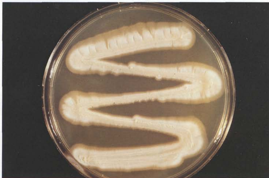
Abb. 1: Geotrichum-nova-species -Kultur – biochemisch war keine eindeutige Artzuordnung möglich – bei Zimmertemperatur auf Kimmig-Agar

Pilze der Gattung Geotrichum sind durch die Ausbildung von Luftmyzel und Arthrosporen, d.h. Gliederstücken, gekennzeichnet. Sie können mikroskopisch keine Blastosporen, also Sproßzellen, aufweisen. Nach dem D-H-S-Schema, Dermatophyten – Hefepilze – Schimmelpilze, zählen sie damit definitionsgemäß zu den Schimmelpilzen. Das Unvermögen, Sproßzellen zu bilden, unterscheidet sie von Hefepilzen. Hefen sind gerade aufgrund der Blastosporen- und Pseudomyzelbildung gesondert zu betrachten (7, 8, 9).