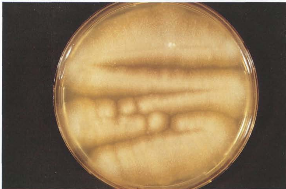
Abb. 2: Geotrichum-candidum -Kultur: Der bekannte eßbare »Milchschnitzschimmel« bei Zimmertemperatur auf Kimmig-Agar gewachsen

Geotrichum -Arten erscheinen makroskopisch meist in weißlich-grauen Farbtönen und lassen – vor allem bei Zimmertemperaturen – Luftmyzel erkennen ( Abb. 1 u. 2 ).