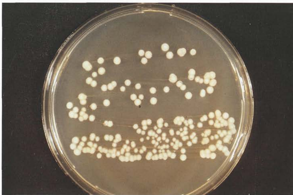
Abb. 3: Geotrichum-candidum -Kultur bei 37 °C auf Kimmig-Agar gewachsen. Das hefeähnliche makroskopische Erscheinungsbild kann zu Verwechslungen führen

sporen zerfallen ist, kann dies unter Umständen, z.B. nach Abrundung der Arthrosporen bei Flüssigkeitsaufnahme, zu Verwechslungen mit Hefe-Sproßzellen führen (3, 7).