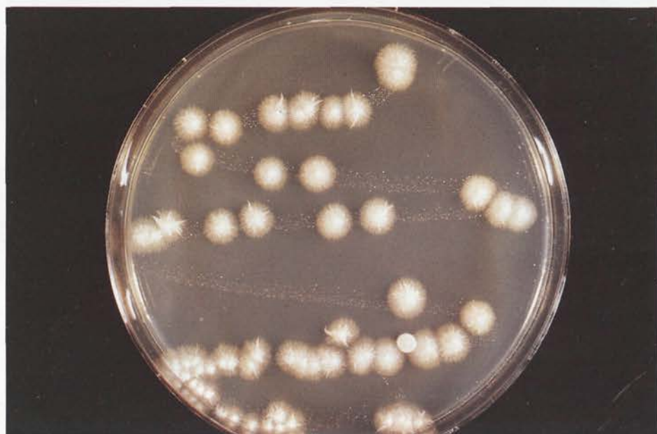
Abb. 4: Kultur von Candida albicans bei 37°C auf Kimmig-Agar. Bei bloßem Hinsehen ist die Kultur makroskopisch mit Geotrichum -Arten zu verwechseln

Die Tabelle nach Morenz (Tab. I) zeigt, daß verschiedene Geotrichum -